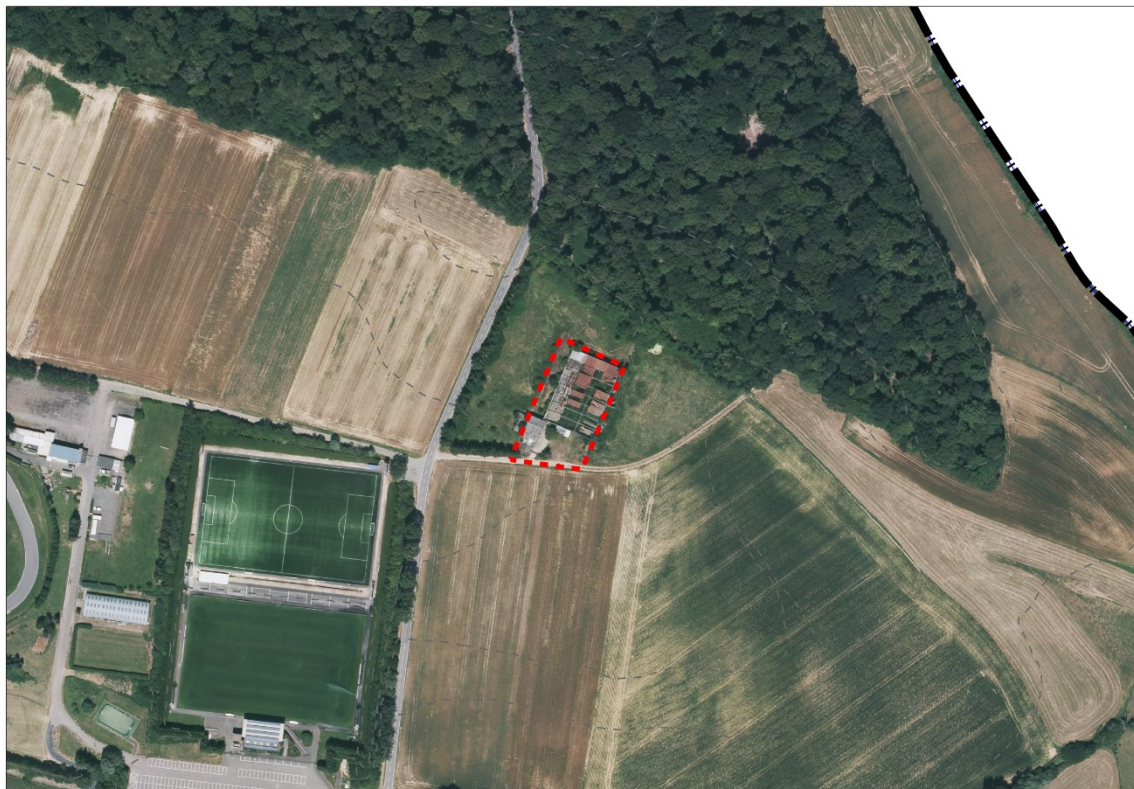
Abbildung 2 Verortung des Plangebietes (Luftbild)