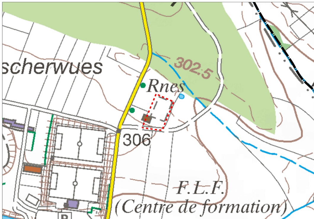
Abbildung 1 Verortung des Plangebietes (Topografische Karte)