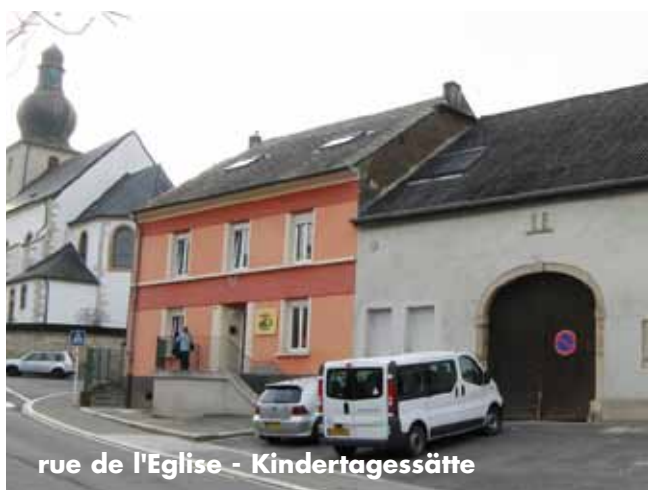
rue de l'Eglise - Kindertagesstätte

Umbau einer Scheune in der „rue de l'église“ in eine Tagesstätte