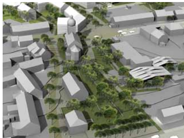
Plan du nouveau parc à Mondercange

Intervention de Monsieur Servais Quintus (Déi Gréng) au sujet des terrains dans la rue des bois à Mondercange, de la décharge pour déchets inertes et du transport en commun.