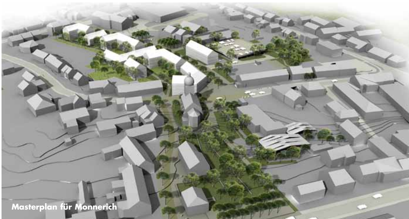
Masterplan für Monnerich

b) 135614,90 Euro für Renovierung und energetische Massnahmen einer Kindertagesstätte in der rue de l'église in Monnerich.